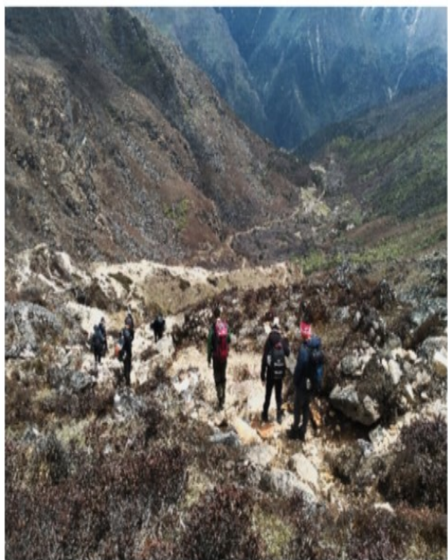
Distribution of SIM

“Concerned that the prolonged school closure could hit the innocent students of Lunana hard who are keen to learn and explore the world through education, the teachers have decided to deliver the lessons through door to door service with the distribution of Self Instructional materials (SIMs).”