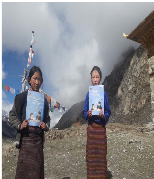
Students with SIM

“ Students felt the learning is stepping towards their zone of fulfilling the dreams..”