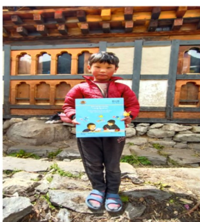
SIM To Lunana

“In the due course, we have seen the smile of satisfaction in the students which indicated the joy in learning. We continued walking and explaining about SIM over eight students in Wachay .”